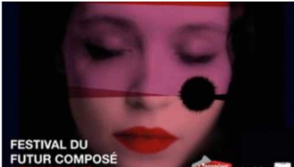
Affiche du festival du «Futur Composé».