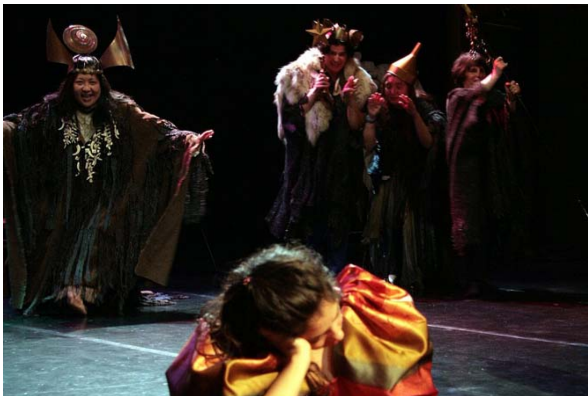
La comédie musicale Blanche Neige , présentée au sein du Festival du Futur composé.

Le Festival du Futur composé ouvre les portes de sa 8 ème édition. Artistes amateurs ou professionnels, autistes ou non-autistes, prennent part à cette nouvelle célébration de l'échange, et de la différence.