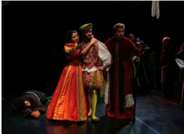
La comédie musicale Blanche Neige