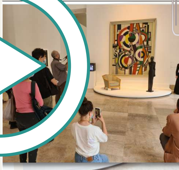
2021 : " D'abord un tout " : Collections permanentes