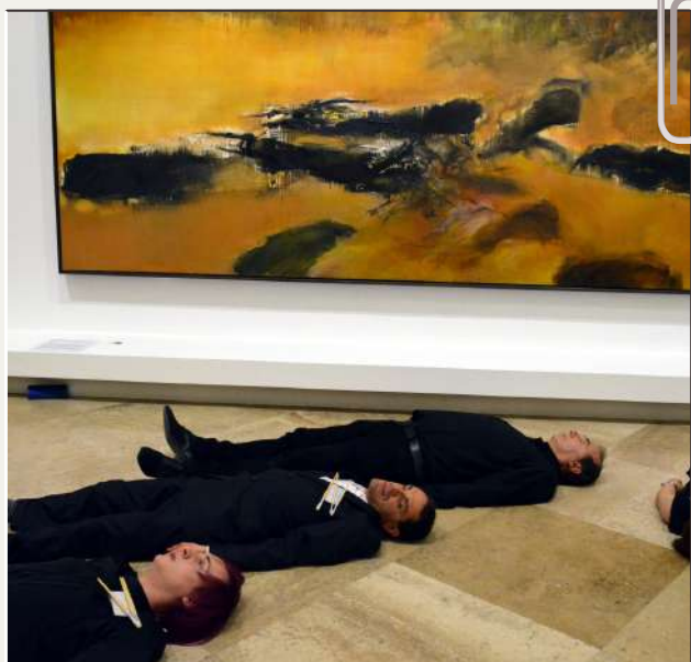
2018 : Exposition "L'espace est silence", Zao Wou-ki